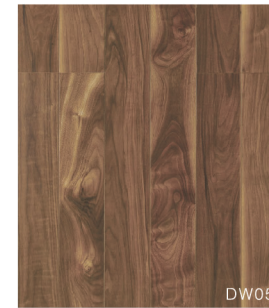
DW05 ワイルドウォールナット柄