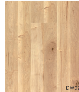
DW02 ワイルドメイプル柄