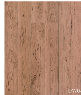
DW04 ワイルドチェリー柄