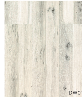
DW01 ワイルドホワイト柄