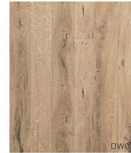
DW03 ワイルドオーク柄