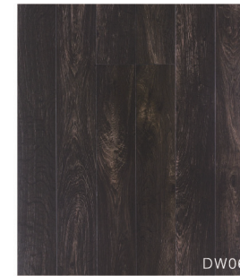
DW06 ワイルドダーク柄